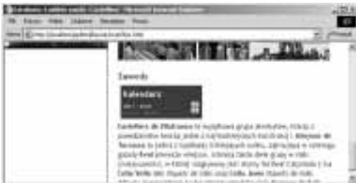
Rysunek 11.41. Teraz akapit dates ma dokładnie 150 pikseli szerokości i 2 em wysokości; są w nim wyświetlane paski przewijania, aby użytkownicy mogli zobaczyć całą jego zawartość