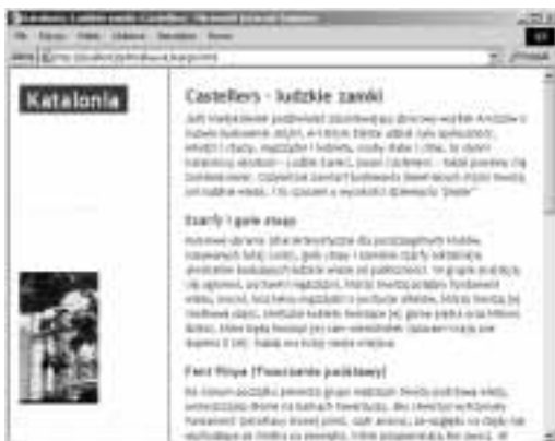
Rysunek 11.30. Tekst prezentowany w dziale content strony wygląda znacznie lepiej, gdy pomiędzy nagłówkiem a akapitem jest mniej wolnego miejsca. Pamiętaj, że margines to obszar pomiędzy prostokątami elementów, których rozmiar jest z kolei określany przez tak różnorodne czynniki, jak zawartość, wysokość wiersza, właściwość height i tak dalej. Zwróć także uwagę, że margines pomiędzy elementem h3 oraz p ma wielkość 15 pikseli (czyli odpowiada większemu z marginesów, a nie ich sumie, która ma wartość 20 pikseli)