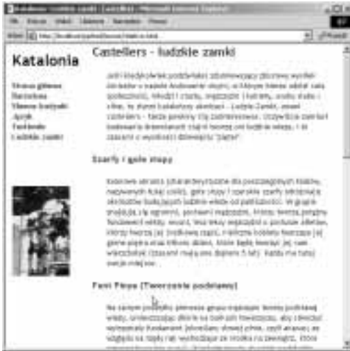
Rysunek 11.14. Nagłówki h2 oraz h3 są przesunięte w lewo poza obszar działu strony, w jakim są umieszczone. Nie ma to jednak żadnego znaczenia — są one przesuwane względem swego oryginalnego położenia, niezależnie od tego, gdzie by się nie znajdowały