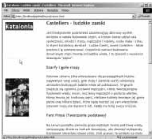
Rysunek 11.22. Teraz, gdy ktoś wskaże łącze do bieżącej strony, nie będzie ono wcale wyglądać jak łącze (choć adres strony docelowej będzie wyświetlany na pasku stanu, a samo łącze będzie działać poprawnie)