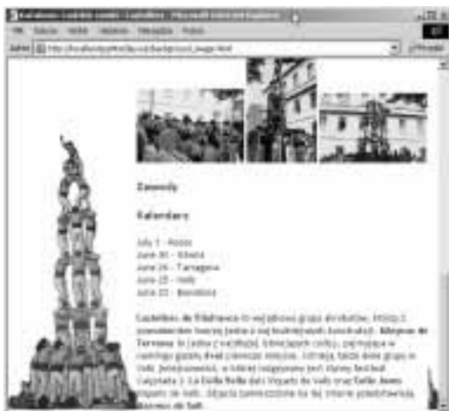
Rysunek 11.18. Pomimo tego, że obraz tła elementu body jest powtarzany w poziomie, jest on przesłaniany przez biały obraz tła działu content (który, dzięki zastosowaniu atrybutu id, jest określany z większą precyzją). Zauważ, że obraz tła rozpoczyna się w lewym, dolnym rogu całej strony, a nie ekranu (jak jest to błędnie interpretowane w IE dla komputerów Macintosh)