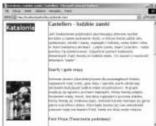
Rysunek 11.24. Oto proste obramowanie o szerokości 1 piksela i postaci linii ciągłej. Zwróć uwagę, że pomiędzy obramowaniem i tekstem elementu przydałoby się wyświetlić jakiś odstęp. Już wkrótce się tym zajmiemy (patrz strona 188)