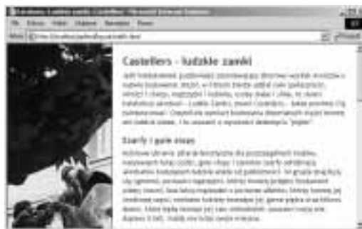
Rysunek 11.33. Zwróć uwagę, że dział zawartości zaczyna się od 30% szerokości strony, licząc od jej lewej krawędzi, zachodzi na dział bg strony. Ponieważ dział zawartości strony ma białe tło, jego część pokrywająca się z tym obszarem będzie niewidoczna. Dodatkowo zwróć uwagę, iż także część nawigacyjna strony jest w tej chwili niewidoczna. Już wkrótce rozwiążemy ten problem