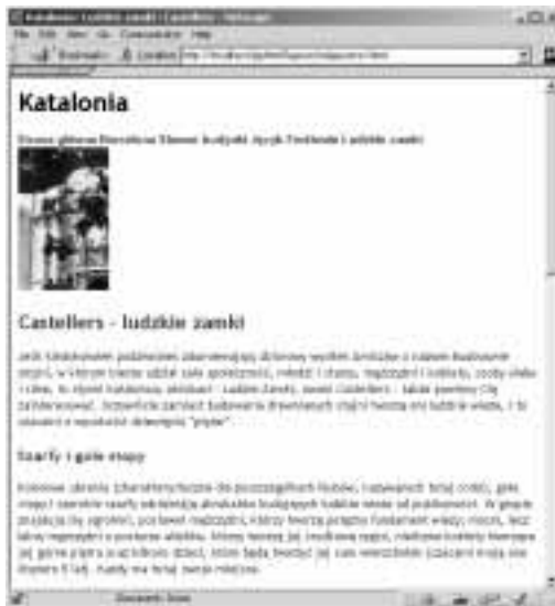
Rysunek 11.3. Oto, jak nasza strona wygląda w przypadku, gdy style w ogóle nie są wykorzystywane (w przeglądarce Netscape 4 dla Windows). Ze względu na swoją odpowiednią strukturę wygląda ona całkiem przyzwoicie, choć może nieco spartańsko