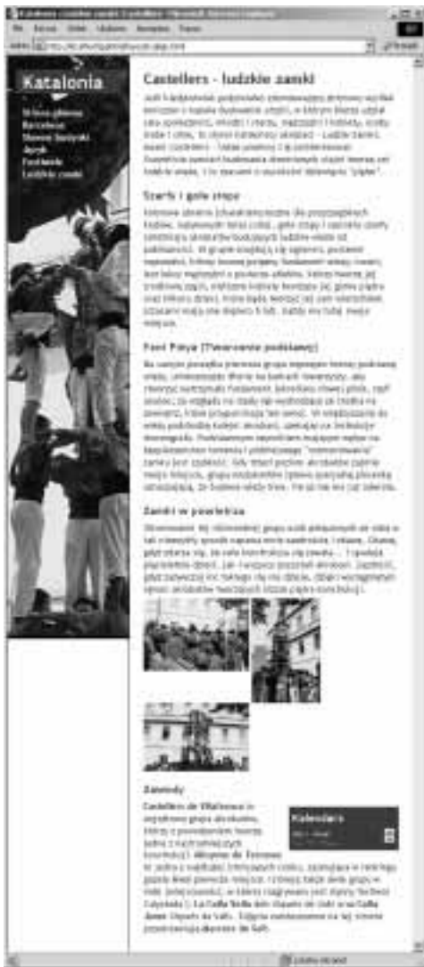
Rysunek 11.1. Układ tej strony został określony przy wykorzystaniu CSS. Został on szczegółowo i dokładnie wyjaśniony w dalszej części niniejszego rozdziału

Wykorzystanie CSS do określania układu strony ma kilka zalet w porównaniu z innymi metodami, takimi jak na przykład tabele (które opisałam w rozdziale 14.). Przede wszystkim CSS doskonale nadają się do tworzenia elastycznych układów , które poszerzają się lub zwężają w zależności od wielkości okna przeglądarki. Poza tym oddzielenie zawartości strony od instrukcji określających jej wygląd daje możliwość bardzo łatwego wykorzystania tego samego układu w całej witrynie. Dzięki temu, modyfikując jedynie plik CSS, można także bardzo łatwo i szybko zmienić wygląd całej witryny. Co więcej, połączenie CSS z (X)HTML pozwala zmniejszyć rozmiar plików, co z kolei oznacza krótszy czas oczekiwania na wyświetlenie witryny. W końcu, ponieważ CSS i (X)HTML są aktualnie używanymi standardami, można mieć gwarancję, że strony utworzone zgodnie z ich założeniami będą poprawnie wyświetlane w przyszłych wersjach przeglądarki (poza tym stosowanie tych standardów stanie się koniecznością dla profesjonalnych projektantów stron).