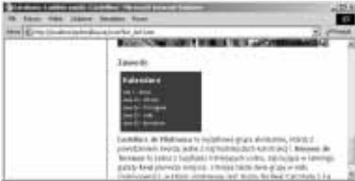
Rysunek 11.39. Kalendarz wygląda całkiem ładnie u dołu strony, ale według mnie jest zbyt długi

<calendar id="calendar" style="width:150px; height:2.5em; overflow:auto;" />