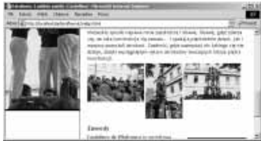
Rysunek 11.49. Wszystkie trzy obrazki należące do klasy line są wyrównane w pionie względem swych górnych krawędzi