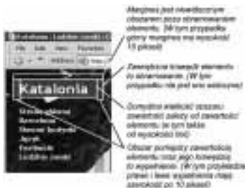
Rysunek 11.4. Prostokąt każdego elementu posiada cztery istotne cechy określające jego wielkość (podane tutaj w kolejności od środka obszaru elementu): obszar zawartości, wypełnienie, krawędzie oraz margines. Każdą z tych właściwości (a nawet wybrane cechy każdej z nich) można określać niezależnie od pozostałych