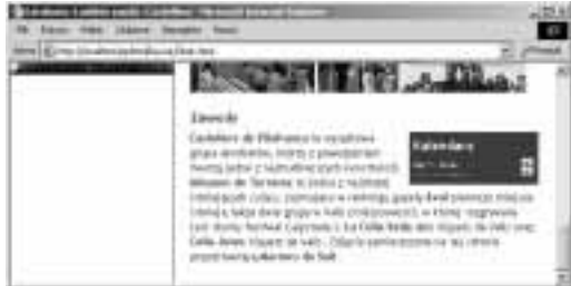
Rysunek 11.43. Tekst umieszczony bezpośrednio za działem calendar otacza go z lewej strony

</div><div style="float: left; width: 150px; height: 150px; border: 1px solid black; margin-left: 5px; margin-top: 7px; float: right; width: 150px; clear: right;"/>