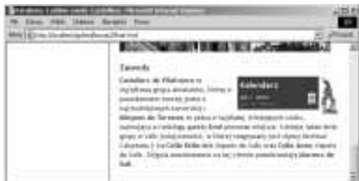
Rysunek 11.45. Ponieważ niewielki obrazek jest umieszczony w kodzie (X)HTML przed elementem div , zostanie on wyświetlony z jego prawej strony