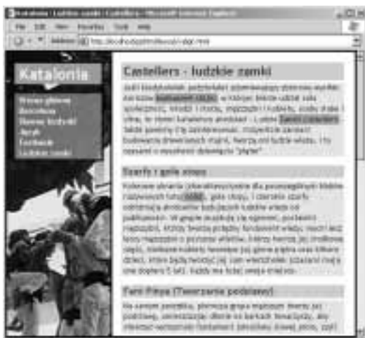
Rysunek 11.5. Każdy element posiada własny prostokąt. W tym przykładzie elementami blokowymi są działki strony, nagłówki różnego stopnia, akapity, jak również połączenia nawigacyjne („Strona główna”, „Barcelona”, i tak dalej), które, choć normalnie są elementami wewnątrzwierszowymi, w tym przykładzie zostały zmienione na elementy blokowe. Zwróć uwagę, że elementy wewnątrzwierszowe, takie jak em (na przykład: „budowanie stajni” oraz „Castellers”), nie generują nowych wierszy