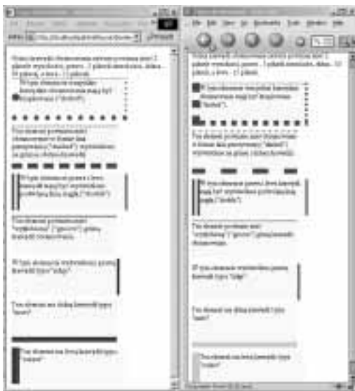
Rysunek 11.26. Zwróć uwagę, jak działają różne właściwości skrótowe. Na przykład border-style: dotted (pierwszy przykład) tworzy kropkowane obramowanie na wszystkich czterech krawędziach, natomiast border-style: dashed none tworzy obramowanie w postaci linii przerywanej na górnej i dolnej krawędzi elementu i nie wyświetla żadnego obramowania na krawędzi prawej i lewej. Przeglądarki (IE 6 z lewej oraz Netscape 7 z prawej) w nieco odmienny sposób interpretują poszczególne style obramowań